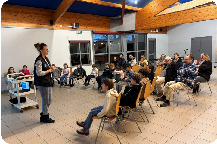
Animation chauves - souris avec la LPO

Nous allons maintenant reprendre le travail sur nos projets de jeux autour de l'étang et de création d'un grand hôtel à insectes pour la commune.