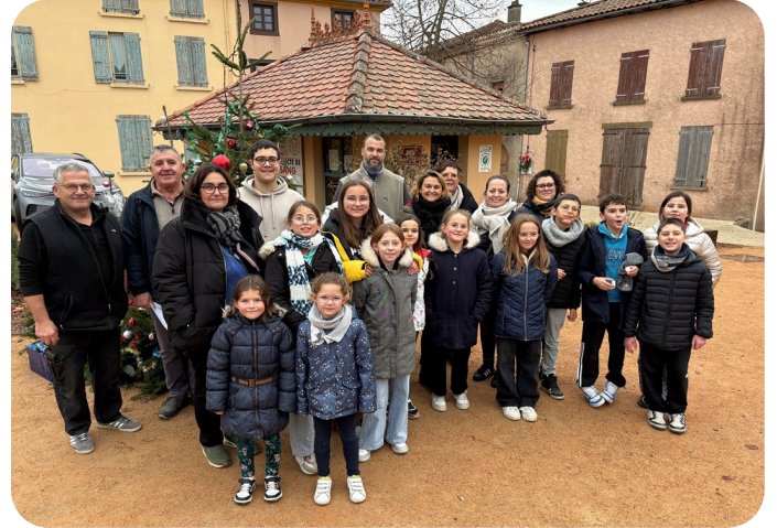
Installation des décorations de Noël dans le village

L'année dernière, nous avons joint un tuto pour faire des pièges de frelons asiatiques afin de protéger nos abeilles. Il est déjà temps de les installer. On compte sur vous !!