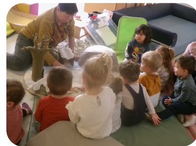
Crèche Les Petits Félinos

- à la crèche Les Petits Félinos, une animation attendue avec impatience chaque mois, avec l'échange du lot de livres prêtés, car les enfants sont très friands d'histoires.