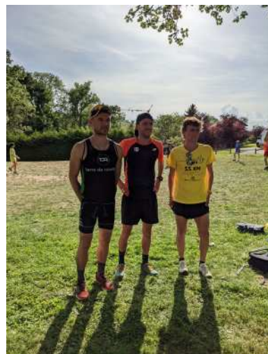
Les trois vainqueurs masculins des quatre boucles

Même si le nombre de coureurs était en deçà de celui connu lors des précédentes éditions, cette nouvelle formule a semblé plaire au plus grand nombre et la journée s'est passée sous les meilleurs hospices. Le bureau remercie une nouvelle fois les nombreux bénévoles.