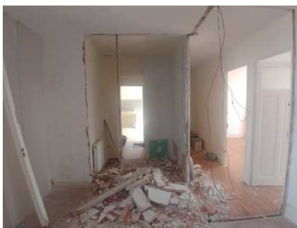
Appartement de 95m 2

Des travaux d'amélioration à la cantine, à l'école et à la mairie ont été réalisés grâce au soutien financier du Département de la Loire et de la Région Auvergne Rhône-Alpes. Ainsi, notre collectivité a pu changer l'ensemble des huisseries situées au-dessus de la mairie mais aussi la réfection de l'appartement de 95m 2 . Dès l'achèvement des travaux, l'appartement sera mis à la location.