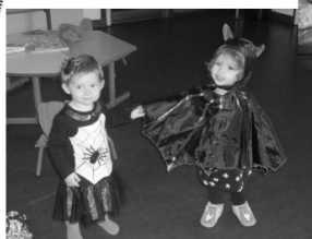
Halloween à la crèche