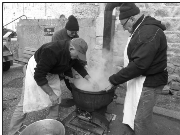
Téléthon : Fabrication du boudin

Amis jardiniers, nous comptons sur vos légumes pour la soupe, à déposer jeudi 24 novembre à la salle du temps libre.