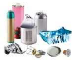
Emballages métalliques y compris les petits