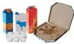
Briques alimentaires et emballages en carton