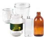
Pots, bocaux, flacons en verre