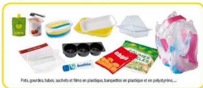
Pots, gourdes, tubes, sachets et films en plastique, barquettes en plastique et en polystyrène,...