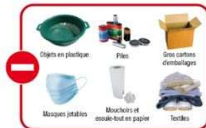
Objets en plastique