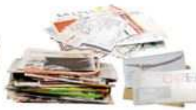
Tous les papiers : journaux, magazines, publicités, enveloppes, courriers, cahiers, ...