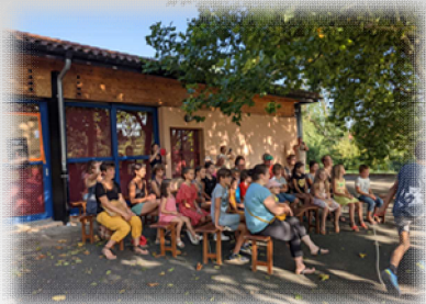
Spectacle « Le petit poucet » dans le cadre du festival des arts de la rue par Monts et par Veauche