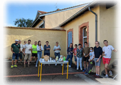
Nouvel aménagement du groupe scolaire