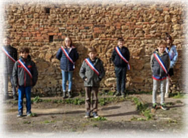
Installation du nouveau Conseil Municipal des Enfants