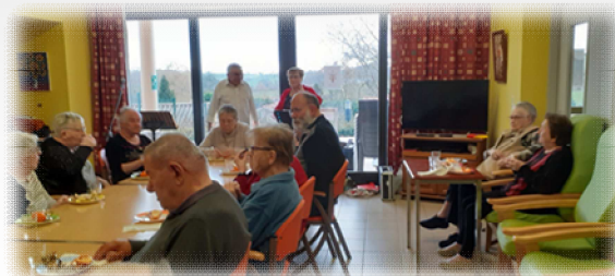
Animation à la MAPA organisée par la commission solidarité