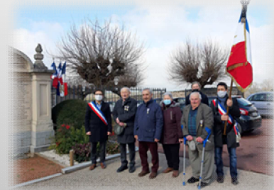
Commémoration du 19 mars