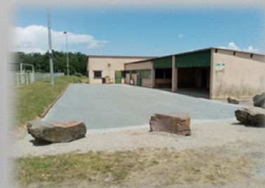
Travaux terrain de foot