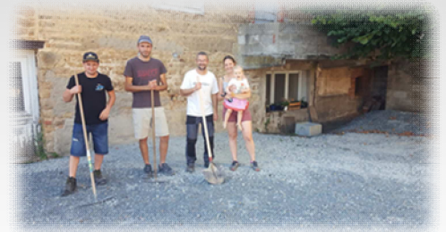
Chantier collaboratif pour l'aménagement de la cour de la cantine