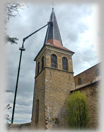
Travaux au clocher de l'Eglise