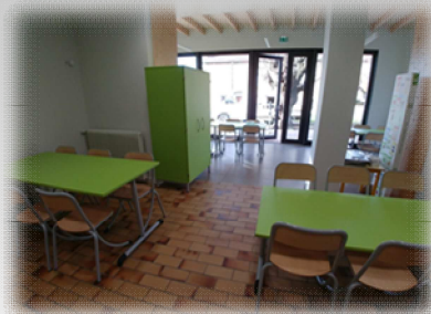
Nouveau mobilier à la cantine