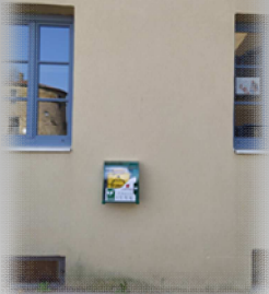
Installation d'un défibrillateur sur la façade du bâtiment « la Ruche »