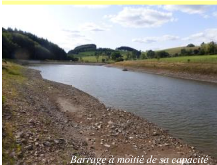
Barrage à moitié de sa capacité

En raison des conditions climatiques défavorables et du manque de précipitations, le Syndicat du Gantet a pris un arrêté de restrictions d'eau pour préserver la ressource en eau du barrage d'Echansieux. Par arrêté du 16 juillet 2019, le lavage des voitures, l'arrosage des jardins, pelouses et massifs fleuris, la mise