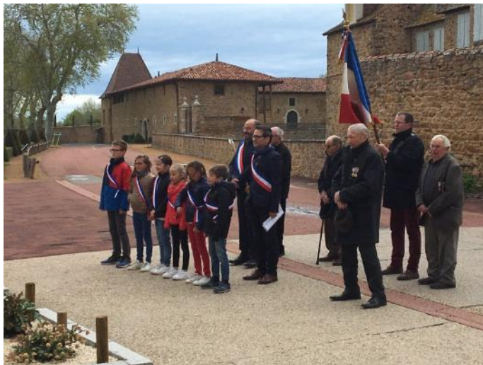
Commémoration du 08 mai 1945

Les enfants du conseil municipal des enfants se sont déjà réunis à plusieurs reprises. Ils ont commencé à travailler sur deux principaux projets: "mettre en place un jeu de piste à travers le village" et "trouver un nom à l'école". Ils vont dans les prochains mois proposer une collecte de jouets en faveur d'associations. Le conseil municipal des enfants est toujours également représenté lors des commémorations.