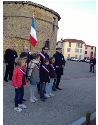
Commémoration du 19 mars 1962