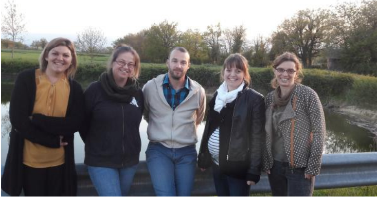
Les nouveaux membres du Comité des Fêtes