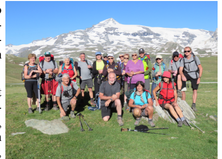
Une sortie à la montagne

Alors, si la randonnée pédestre et l'appartenance à un groupe familial vous séduit, rejoignez les "Pas Pressés", et n'hésitez pas à assister à leur AG qui aura lieu le samedi 29 septembre à 19 h salle du Temps libre.