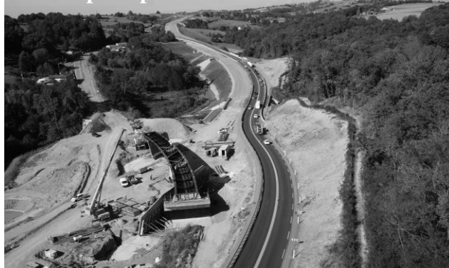
Photo prise par drone.

Les travaux sur le secteur de « la Revoute » avec notamment la création du pont devraient être finalisés fin mars 2017. Le revêtement des chaussées devrait débuter en avril-mai 2017.