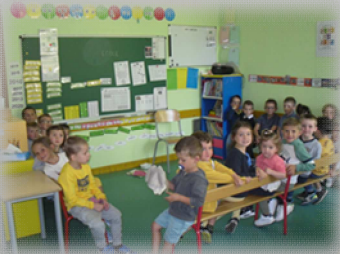
Rentrée scolaire 2021-2022